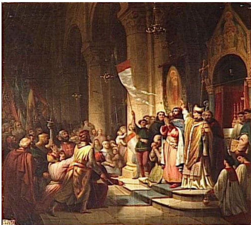
Βονιφάτις εκλεγει ως επικεφαλής της Τέταρτης Σταυροφορίας, Soissons, 1201: Ιστορία ζωγραφική από τον Henri Decaisne, αρχές της δεκαετίας του 1840, Salles des Croisades, Βερσαλλίες. Πίστωση: Henri Decaisne, Wikimedia Commons, Public Domain

Αυτό αναφέρεται στην κατάσταση της πόλης ως το δεύτερο πιο σημαντικό οικισμό της αυτοκρατορίας μετά την Κωνσταντινούπολη. Ο τίτλος έχει επιβιώσει στο χρόνο με τη σύγχρονη Θεσσαλονίκη στην Ελλάδα είναι γνωστό σήμερα ως " συμπρωτεύουσα", με την έννοια ότι είναι με τιμή η "συμπρωτεύουσα" της Ελλάδας, το δεύτερο στην Αθήνα.