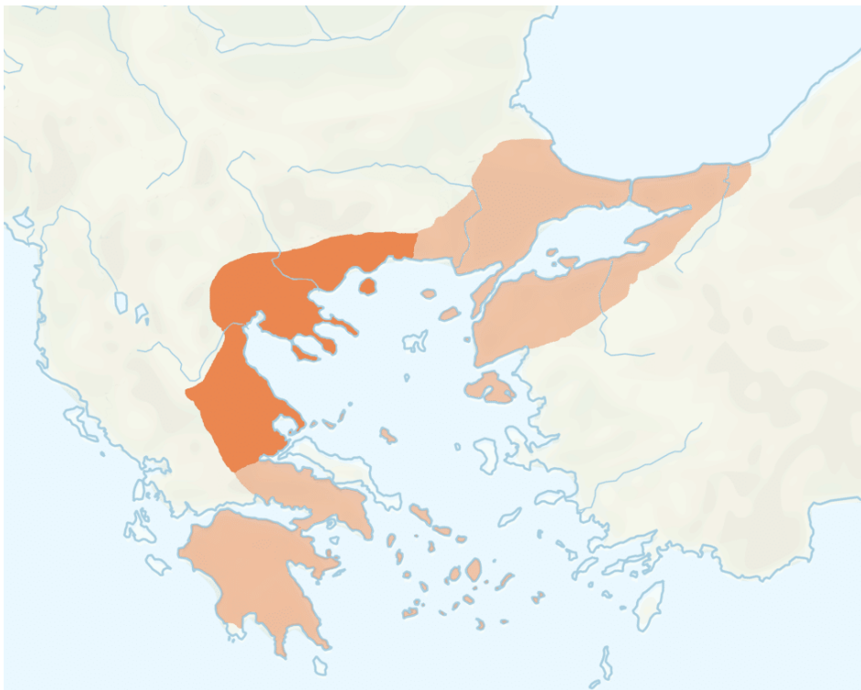
Χάρτης της λατινικής Αυτοκρατορίας και του Βασιλείου της Θεσσαλονίκης μέσα σε αυτό.

Boniface εξελέγη ως ο πρώτος Βασιλιάς της Θεσσαλονίκης. Ωστόσο, η βασιλεία του ήταν σύντομη. Το 1207, ήταν ενέδρα και σκοτώθηκε από τους Βούλγαρους, με το κεφάλι του που έστειλε να Τσάρου Καλογιάν.