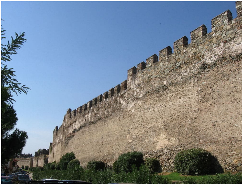
Стены Салоник.

В беспокойные годы, последовавшие за завоеванием Константинополя в 1204 году во время Четвёртого крестового похода, возникло несколько новых латинских и византийских греческих государств. Эти государства были созданы, чтобы заполнить вакуум власти, образовавшийся после распада и ослабления Восточной Римской империи, известной сегодня как Византийская империя. Одним из этих новых государств было Фессалоникское королевство — недолго просуществовавшее, но сыгравшее важную роль в обширном греческом регионе, обладавшее смелыми устремлениями и целями. Целью этого королевства было восстановление Византийской империи на базе Северной Греции. Королевство Фессалоники, которым правили Бонифаций Монферратский и его преемники, играло важную роль в политике Греции XIII века, пока не распалось несколько лет спустя.